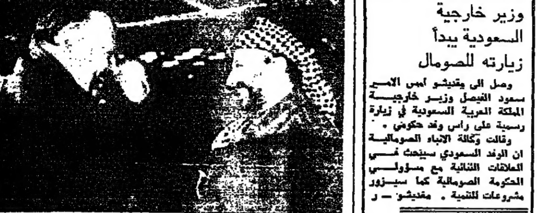
السيد زانغلابين من السعودية السياسية الخارجية في السعودية الشريفي يرحب بالسيد ياس عرفات في موسكو امس